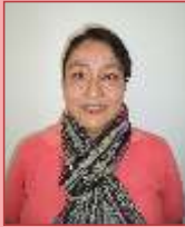
Por: Hna. Fabiola Tapasco RNSCBP