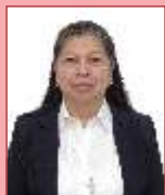
Por: Hna. Rosalba Navarro RNSCBP

La trata de seres humanos es un crimen silencioso, de difícil identificación y de rentabilidad semejante al narcotráfico y al contrabando de armas. No perdona a ningún país y constituye una triste y desafiante realidad del siglo XXI. El 30 de julio es la fecha elegida por las Naciones Unidas para recordarnos la precariedad moral en la que nos movemos con un costo inestimable: la dignidad humana.