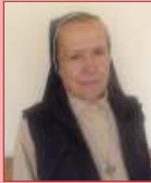
Por: Hna. Francisca Soledad O. RNSCBP