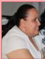
Por: Rocío Riveros Sánchez Coord. Programas FBP